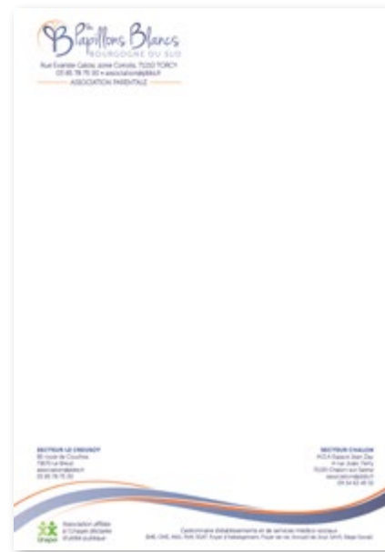
Tête de lettre