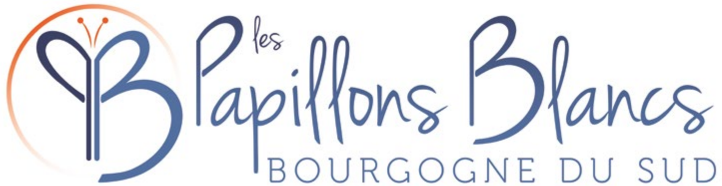
> Logo officiel des «Papillons Blancs - Bourgogne du sud»