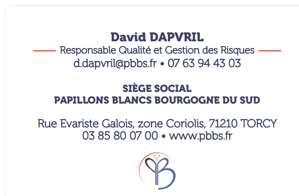
Cartes de visites